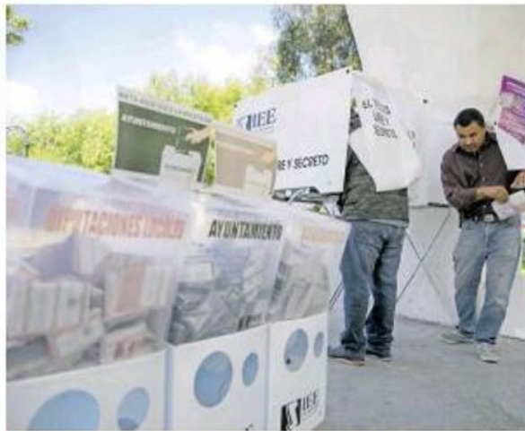
Las elecciones en Baja California se realizarán el 6 de junio de 2021